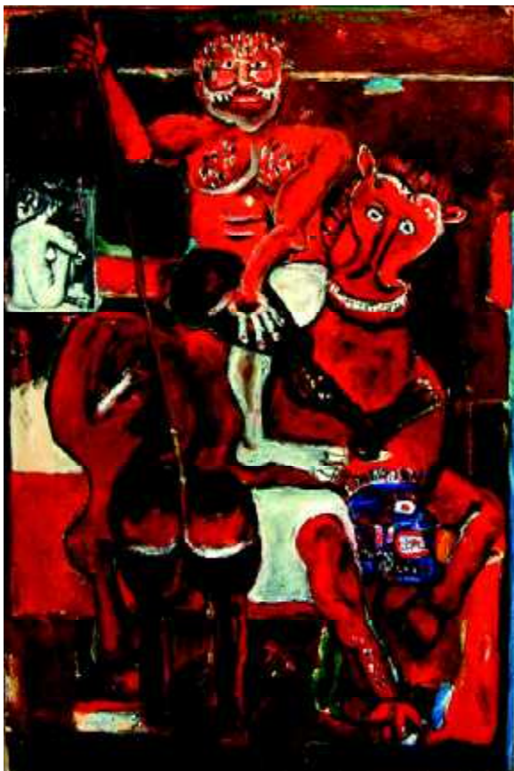
"Dedykacja KOL.Z", 1976, olej na płótnie, 150 x 100