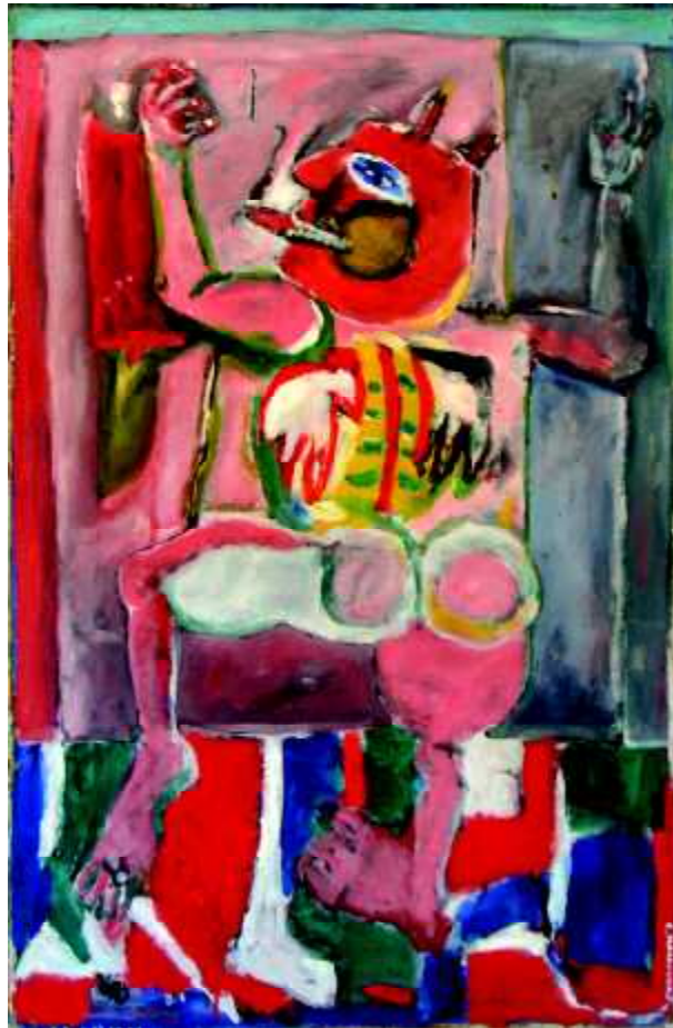
"Diavoletto roseo", 1983, olej na płótnie, 100 x 65