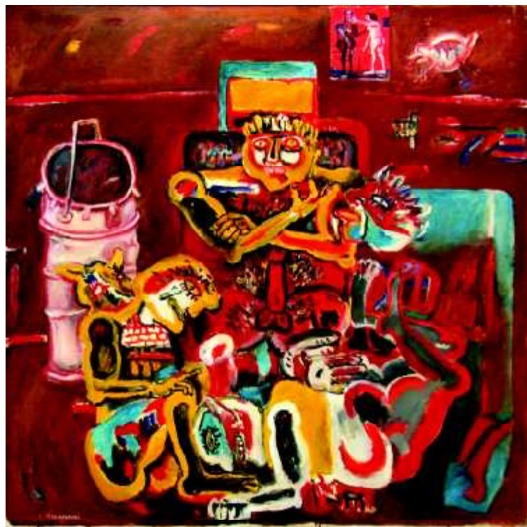
"ZOO" 1973, olej na płótnie, 135 x 135