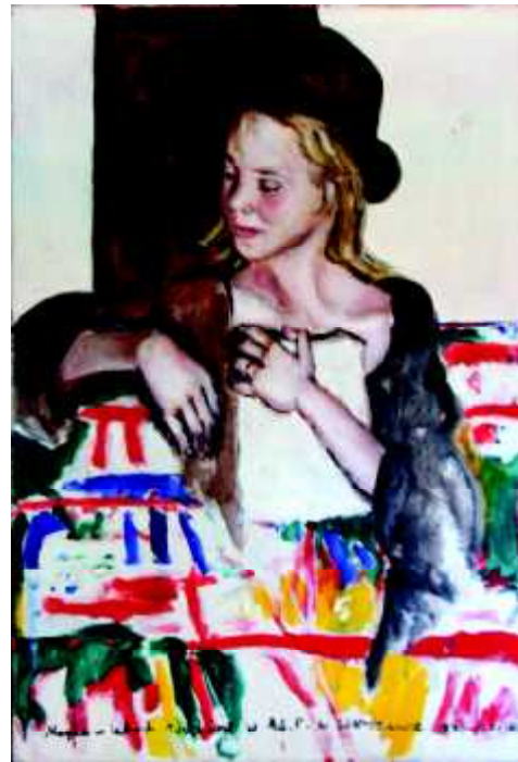
"Magda", 1971, olej na płótnie , 92 x 65,5