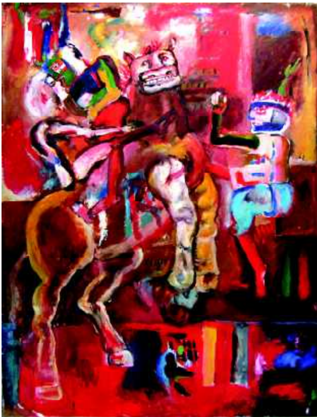
"2-0+K", 1980, olej na płótnie, 170 x 130