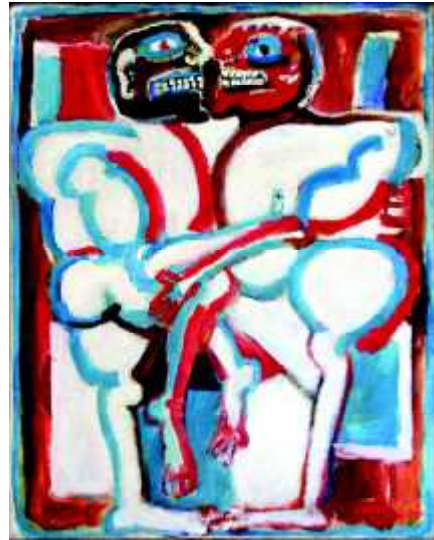
"Abraccio-4", 1973, olej na płótnie, 92 x 73