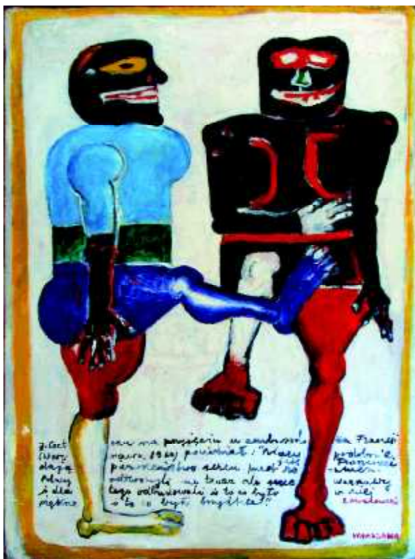
"Moralitet", 1972, olej na płótnie, 120 x 90