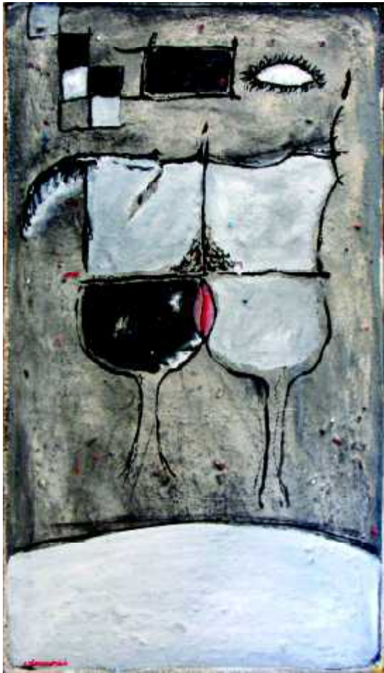
"R-46", 1960, olej na płótnie, 105 x 60