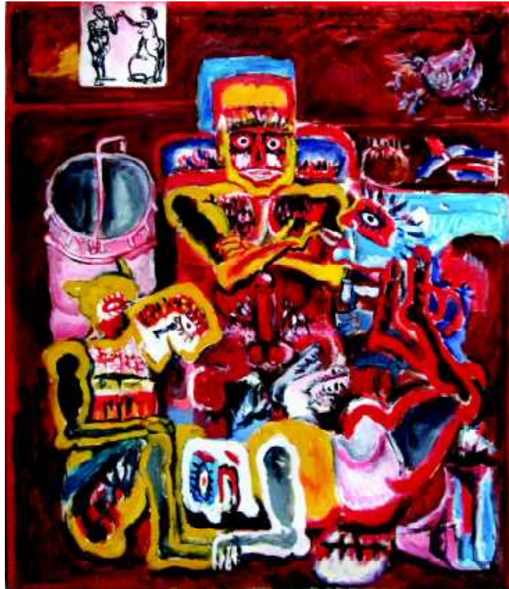
"200-3", 1980, olej na płótnie, 148 x 128