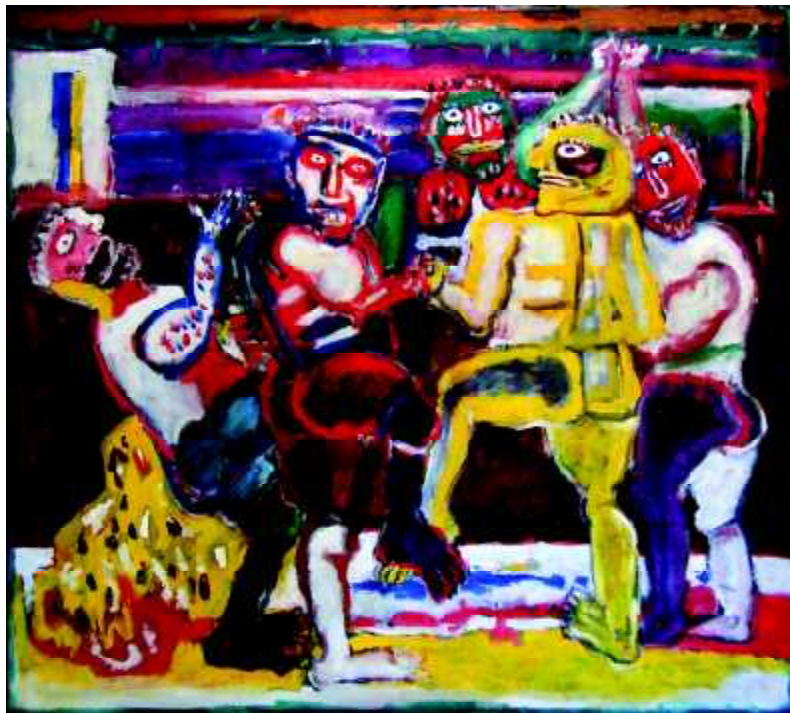
"Dedykacja KOL.-A", 1982, olej na płótnie, 120 x 134