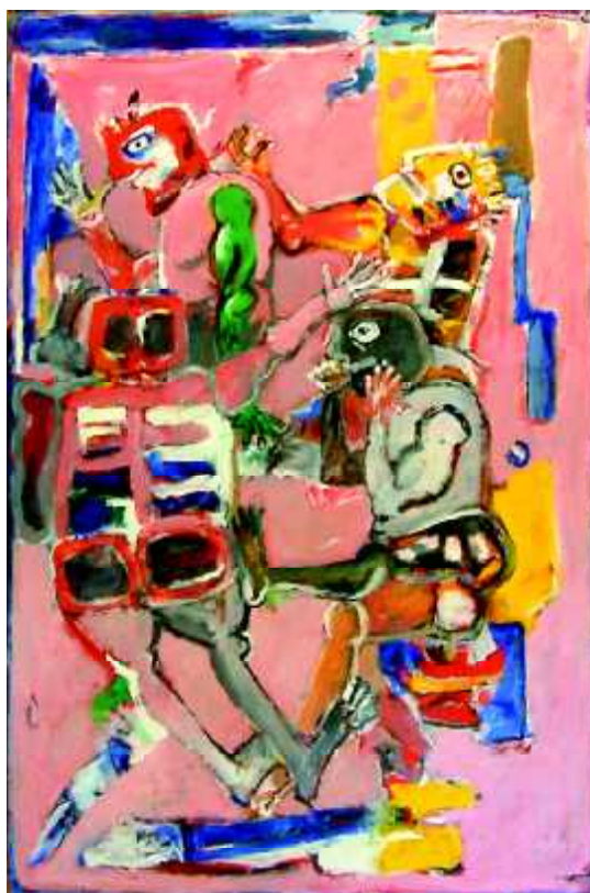
"Memento ", 1966, olej na płótnie, 150 x 100