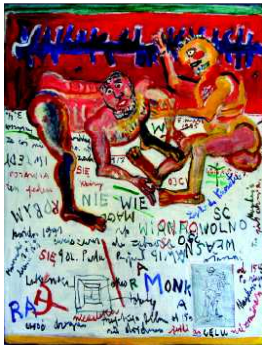
"Kontemplacja - 2", 1976, olej na płótnie, 140 x 135