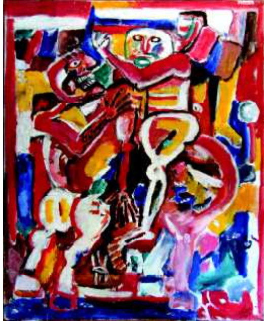
"Partnerzy -3", 1980, olej na płótnie, 135 x 110