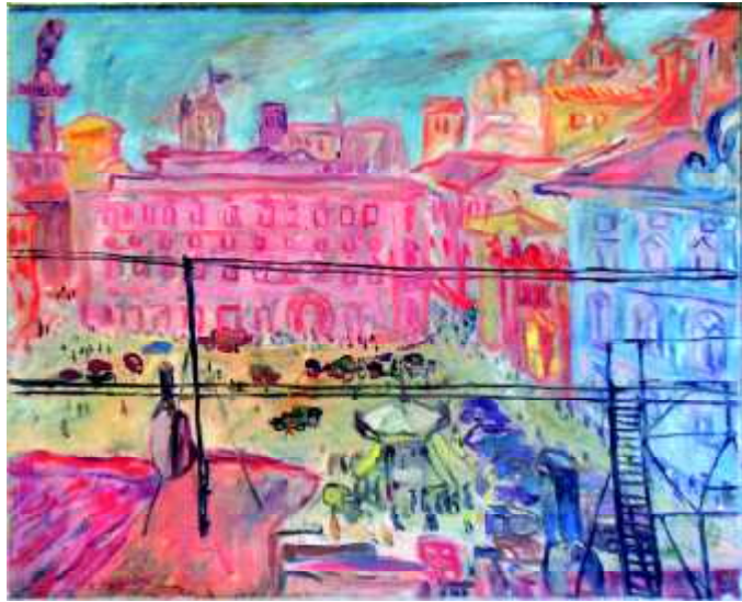
"Piazza S.Silvestro", 1945, olej na płótnie , 60 x 74