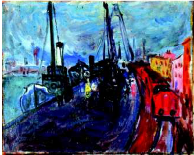
"Ostia-Roma", 1942, olej na płótnie, 40 x 50