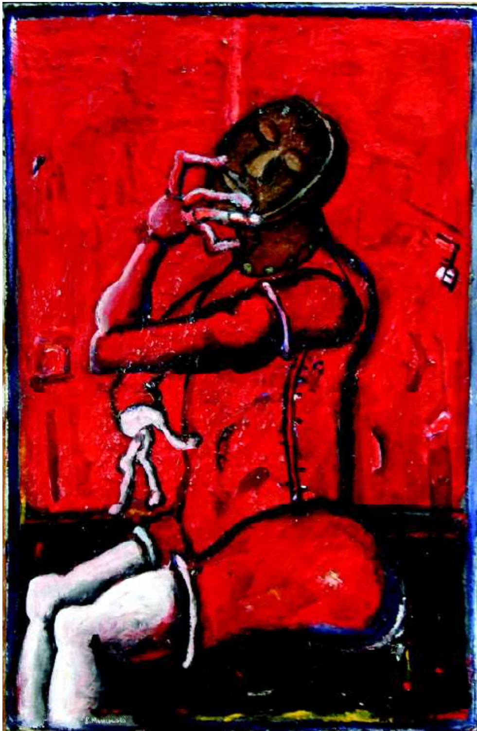
"Manekin R1" 1982, olej na płótnie, 100 x 65