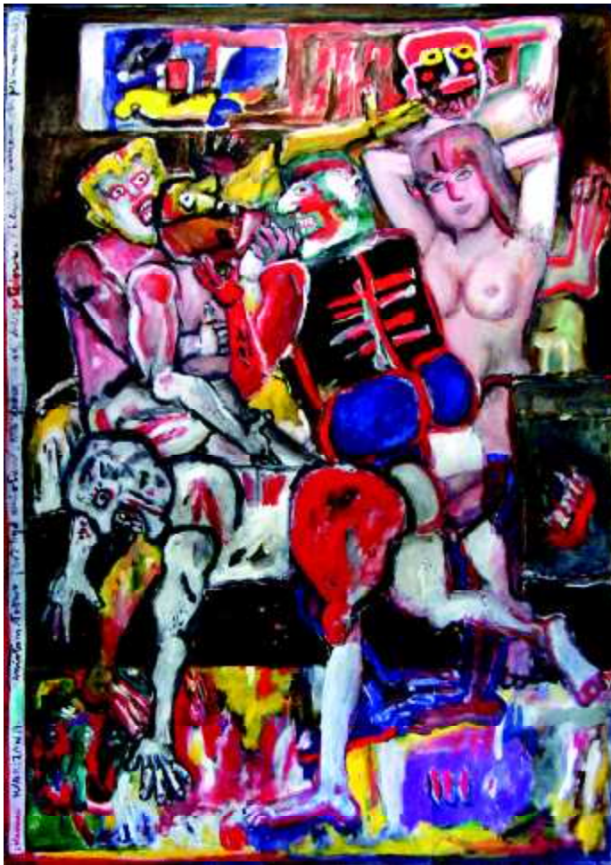
"5+1+AB", 1975, technika mieszana na płótnie, 176 x 125