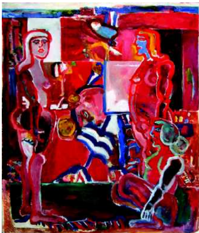
"3 donne", 1976, olej na płótnie, 140 x 120