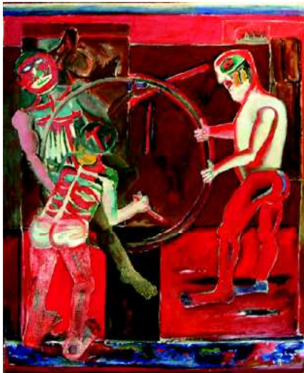
"Koło-2", 1983, olej na płótnie, 135 x 110