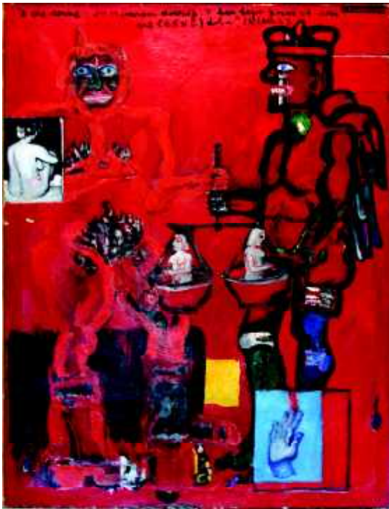
"Moralitet-KOL", 1973, olej na płótnie, 130 x 100