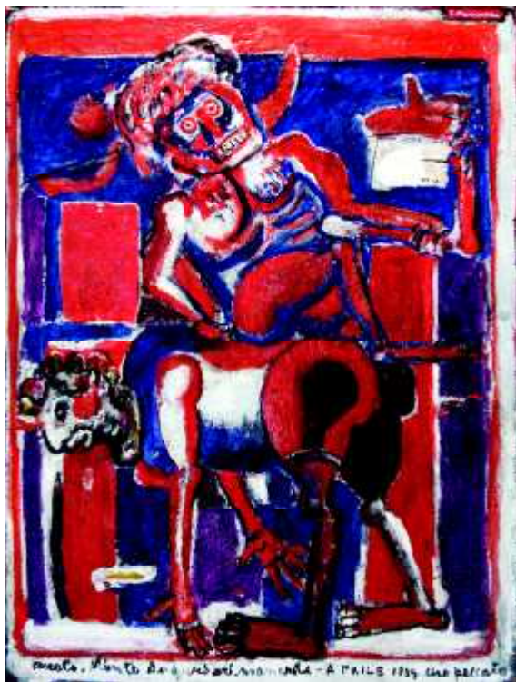
bez tytułu, 1984, olej na płótnie, 132 x 100