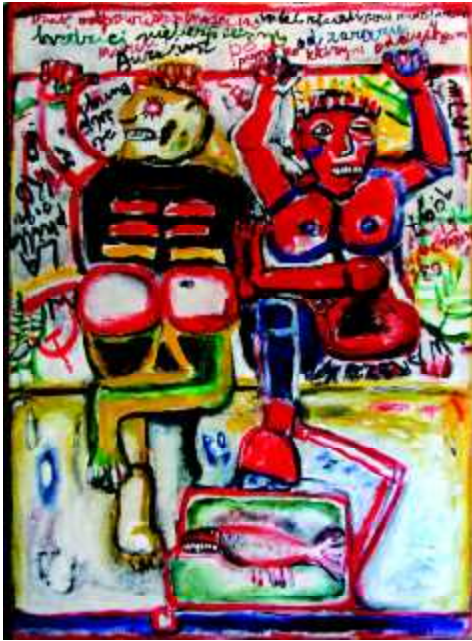
"Gimnastyka", 1977, olej na płótnie, 115 x 85