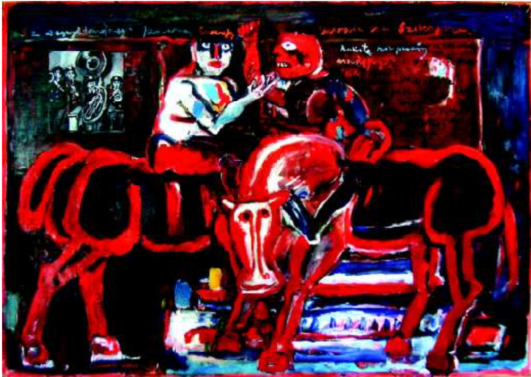
"2x2.CAV", 1980, olej na płótnie, 120 x 170