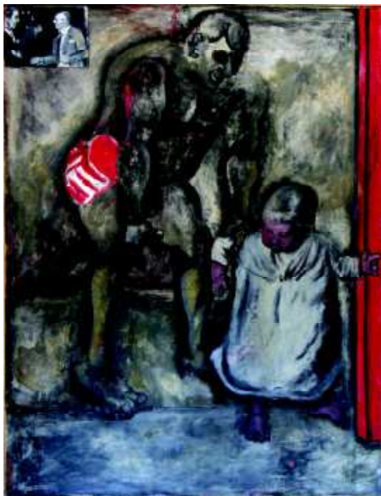
"1+0,1", 1963, olej na płótnie .130 x 100