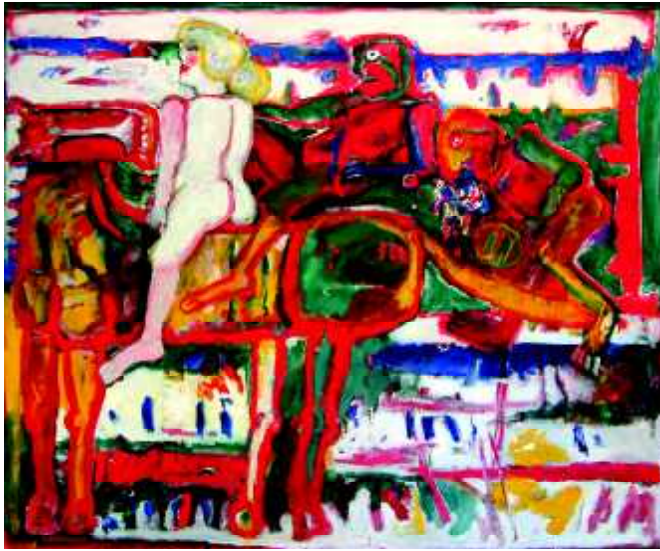
"Amazonka+1+2", 1982, olej na płótnie, 116 x 140