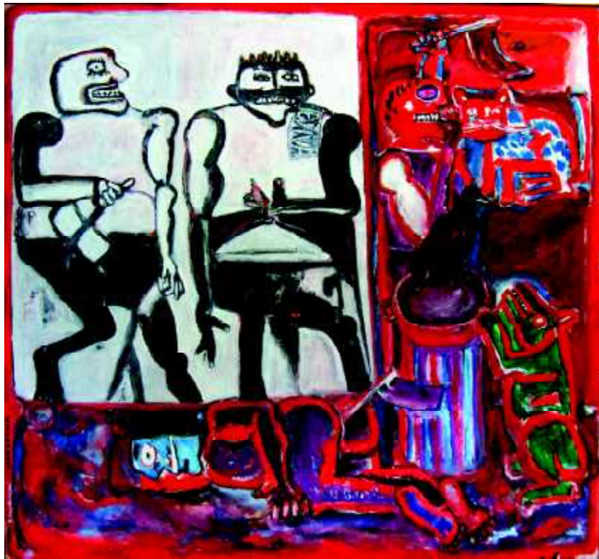
"Evviva", 1975, olej na płótnie, 135 x 145