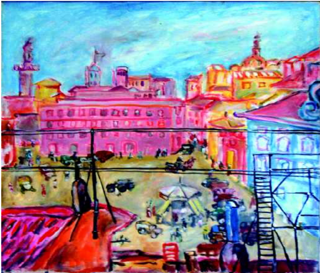
"Piazza, Scherzo", 1945, olej na płótnie, 79 x 92,5