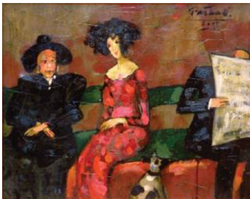
PLANY OLEJ NA PŁÓTNIE 40x51 cm