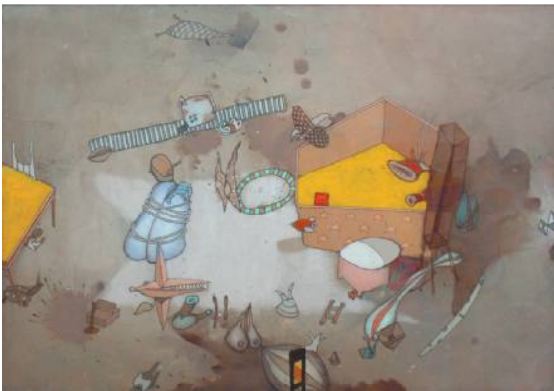
TRUDNO JEST ZROZUMIEĆ ŚWIAT AKRYL NA KARTONIE, 44x62 cm