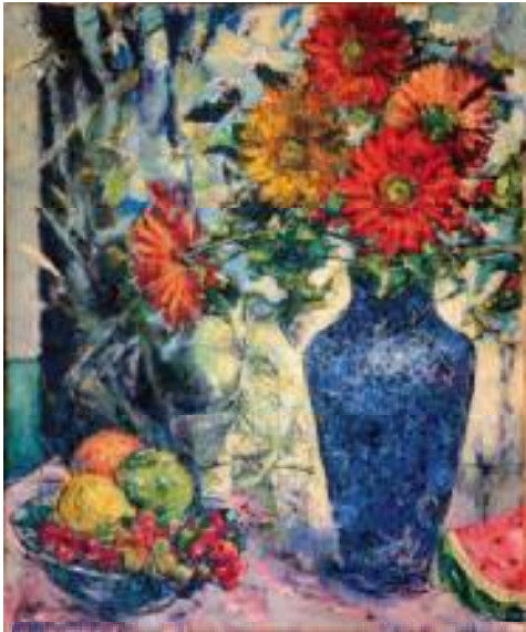
KWIATY OLEJ NA PŁÓTNIE, 59x49 cm