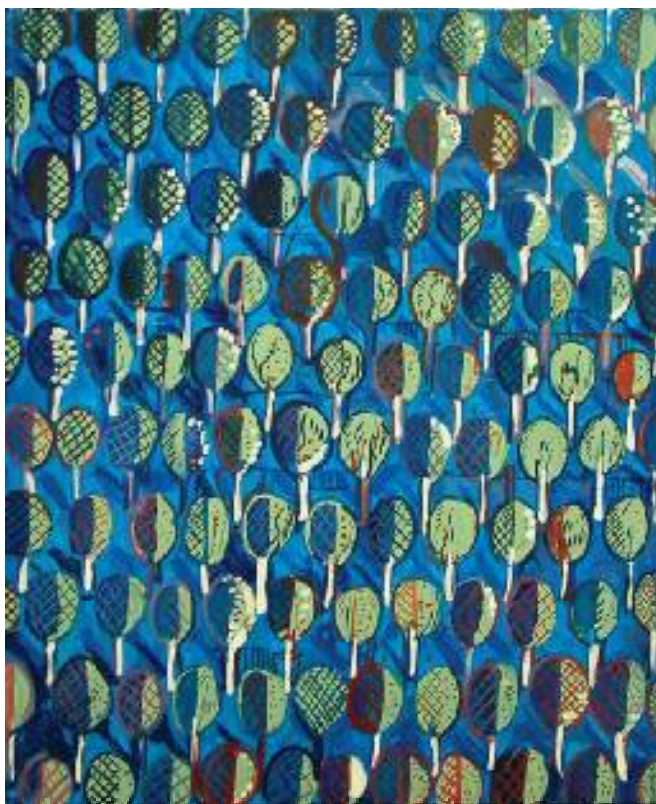
MOGIELNICA, CYKL XXIII OLEJ NA PŁÓTNIE, 73x60 cm