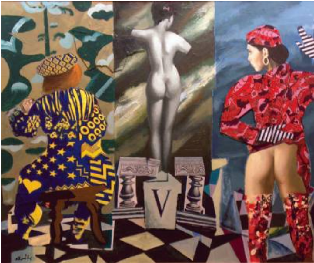
BEZ TYTUŁU, TECHNIKA MIESZANA, 89x107 cm