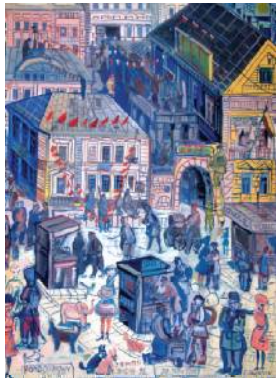
RONDO NOWY ŚWIAT OLEJ NA PŁÓTNIE, 97x70 cm