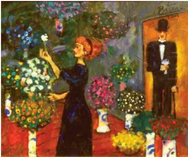
ZALOTY OLEJ NA PŁÓTNIE, 50x60 cm