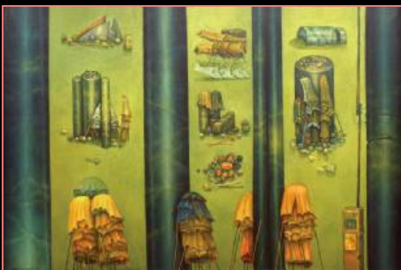
MODLITWY ZEBRANE OLEJ NA PŁÓTNIE, 54x81 cm