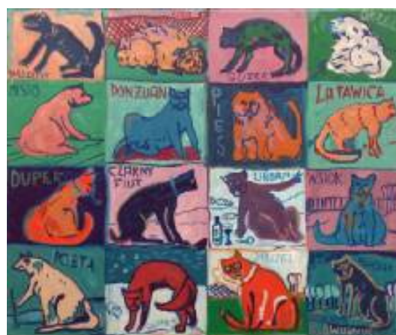
MOJE KOTY OLEJ NA PŁÓTNIE, 46x55 cm