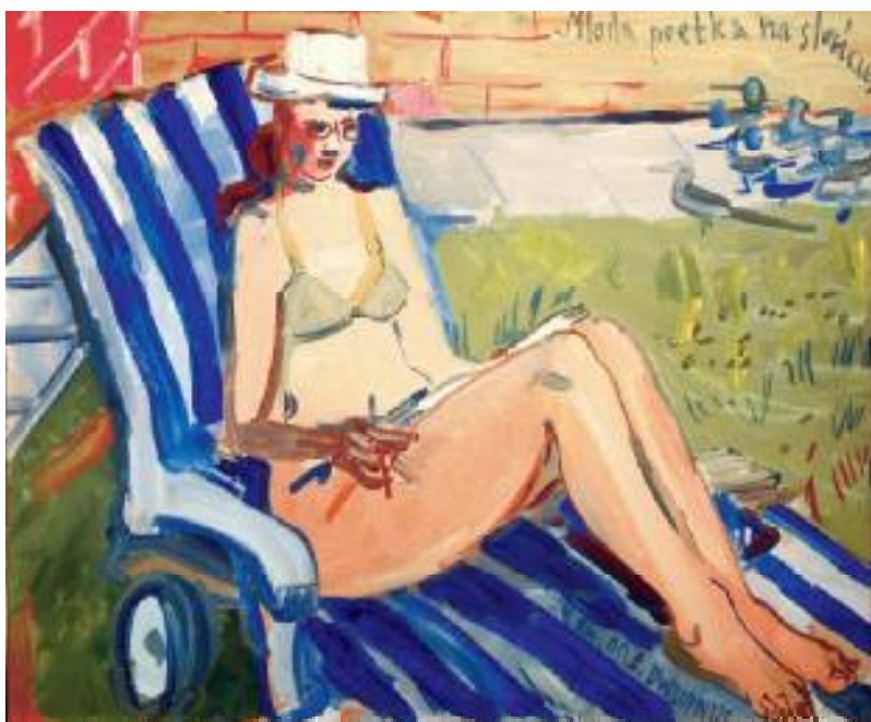
MŁODA POETKA NA SŁOŃCU OLEJ NA PŁÓTNIE, 60x73 cm