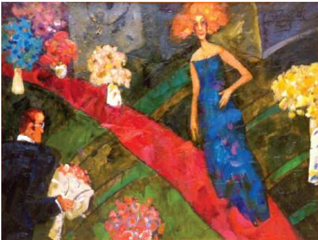
ZALOTY OLEJ NA PŁÓTNIE, 60x80 cm