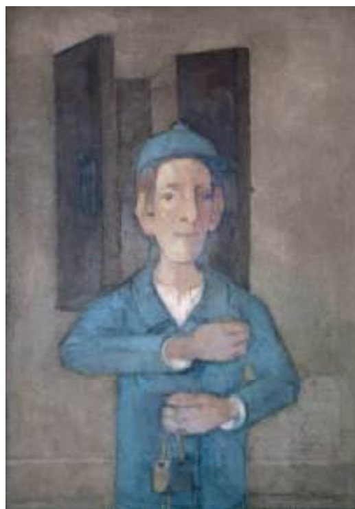
CHŁOPIEC Z PROCĄ, OLEJ NA PŁÓTNIE, 70X50 cm