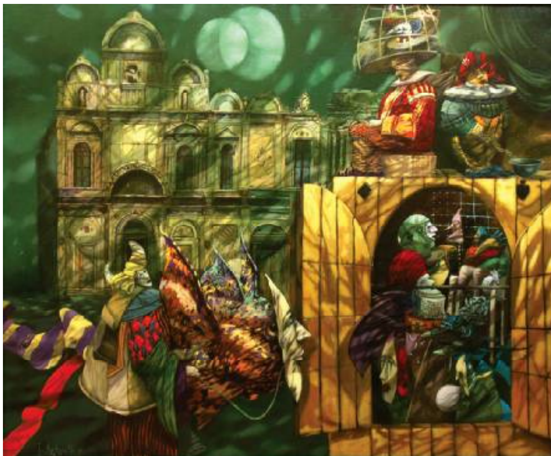
STRAZNICY KOSZMARÓW OLEJ NA PŁÓTNIE, 95x115 cm