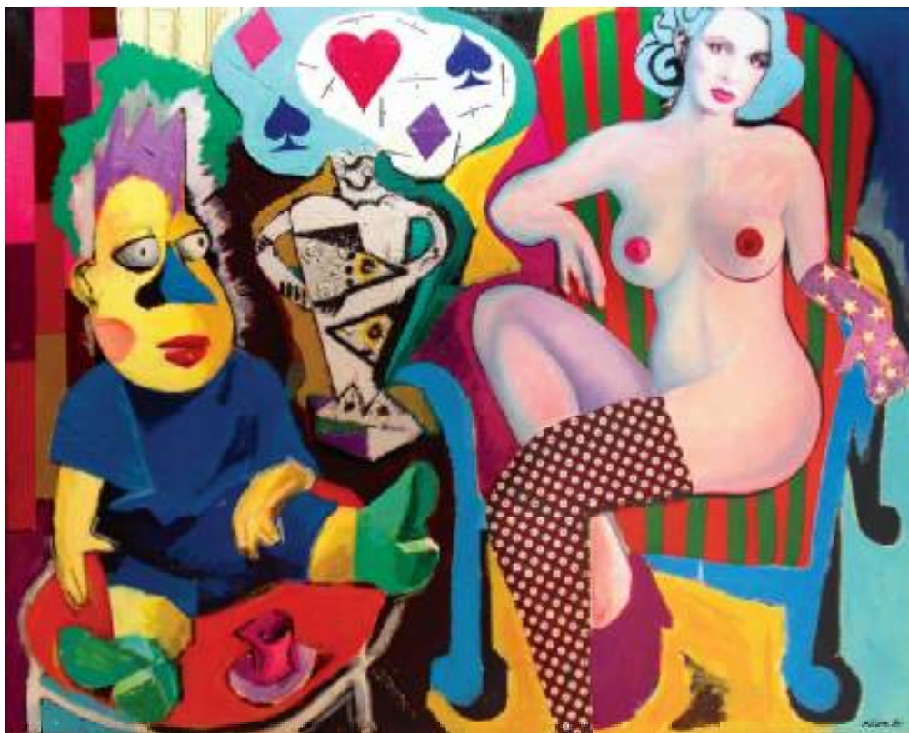
BEZ TYTUŁU, TECHNIKA MIESZANA, 119x149 cm

AMBASADOROWIE TECHNIKA MIESZANA 100x120 cm