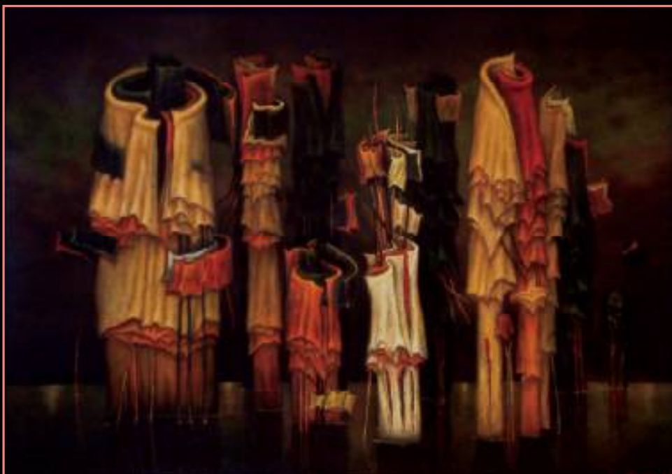
MODLITWA NA WIETRZE III PASTEL NA KARTONIE, 70x100 cm