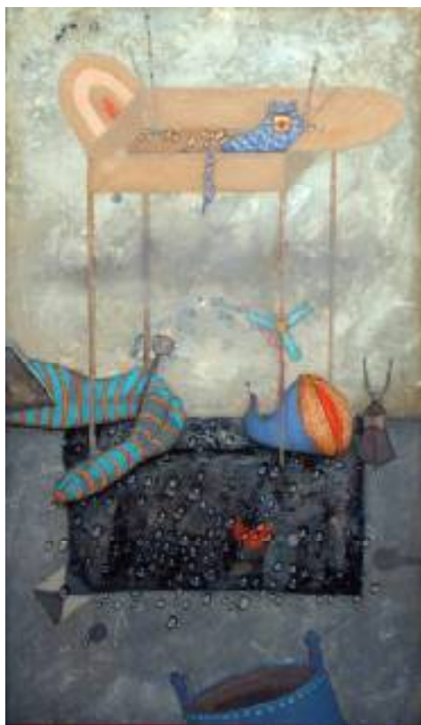
PO OBJEDZIE OLEJ NA PŁÓTNIE, 64x37 cm