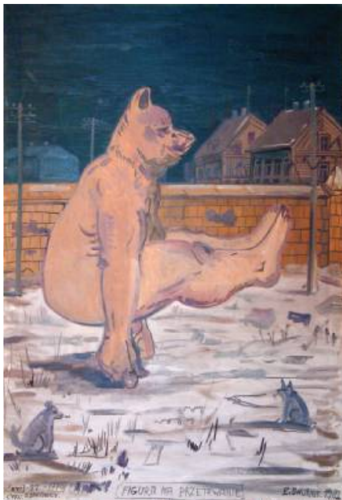
FIGURA NA PRZETRWANIE OLEJ NA PŁÓTNIE 130x89 cm