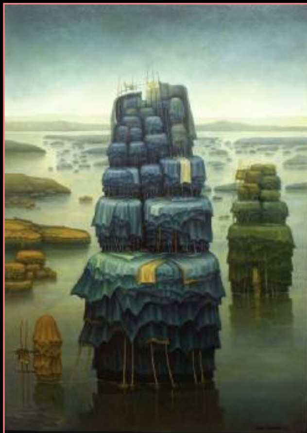
MODLITWA NIEBIESKA OLEJ NA PŁÓTNIE, 92x65 cm