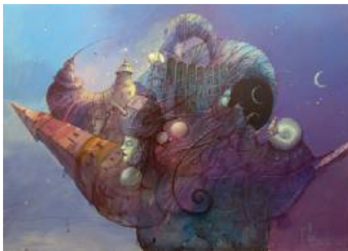
FUTURYSTYCZNE MIASTO AKRYL NA TEKSTURZE, 50x70 cm