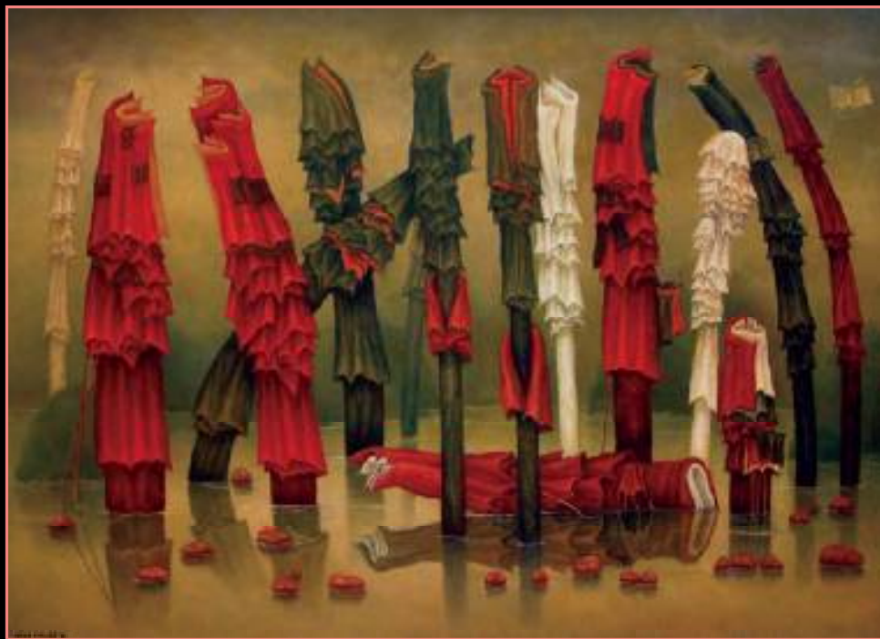
MODLITWA Z MIKOŁOWA IV, OLEJ NA PŁÓTNIE, 72x100 cm