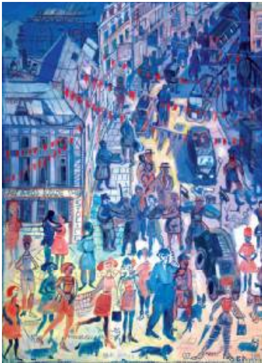
RONDO NOWY ŚWIAT OLEJ NA PŁÓTNIE, 97x70 cm