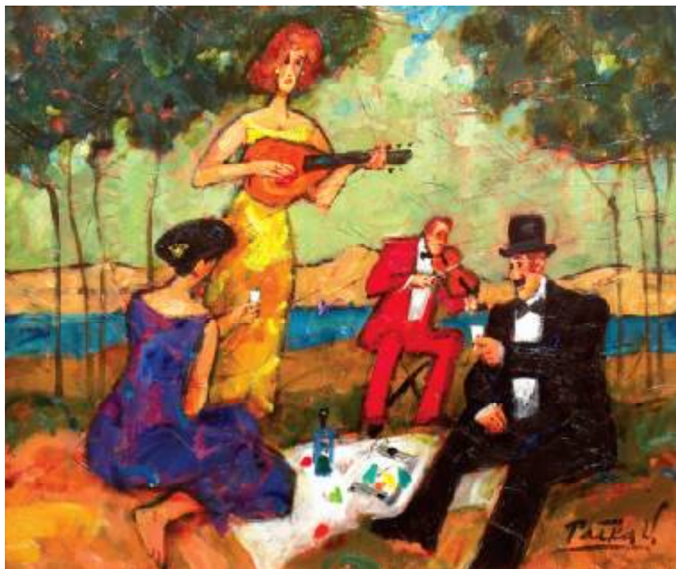
ŚNIADANIE NA TRAWIE, OLEJ NA PŁÓTNIE, 50x60 cm