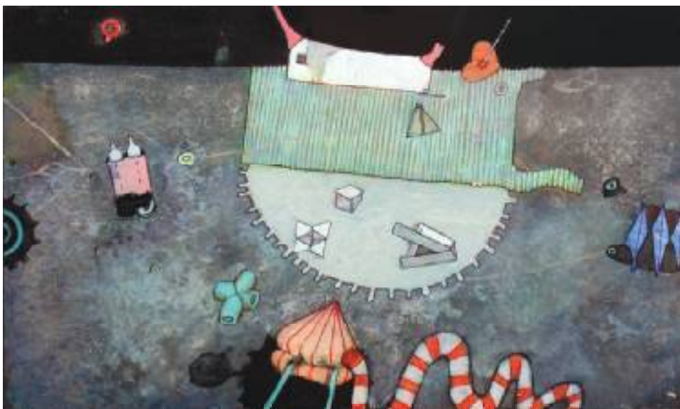
TRZECIA KADENCJA BIAŁEGO WĘŻA, AKRYL NA KARTONIE, 30x48,5 cm