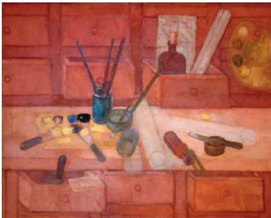
MARTWA NATURA Z PALETAMI, OLEJ NA PŁÓTNIE, 73X92 cm